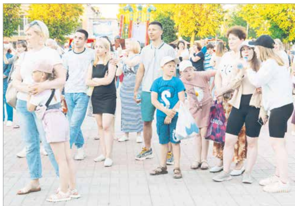
Зрителей на площади собралось немало