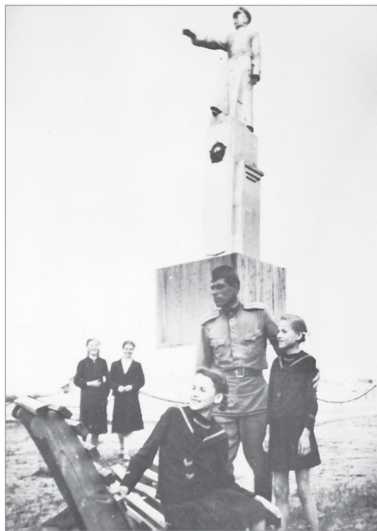
Скульптура группы бойцов у основания цоколя монумента отсутствует из-за разрушений (фото начала 1950-х годов)

И хотя музей продолжал работать еще несколько лет, различные комиссии ЦМКА, проверявшие его деятельность, отмечали, что подчиненность музея различным ведомствам “затрудняет управление музейным комплексом”. Указывалось также и на низкую его посещаемость и недостаточную квалификацию научных сотрудников музея.