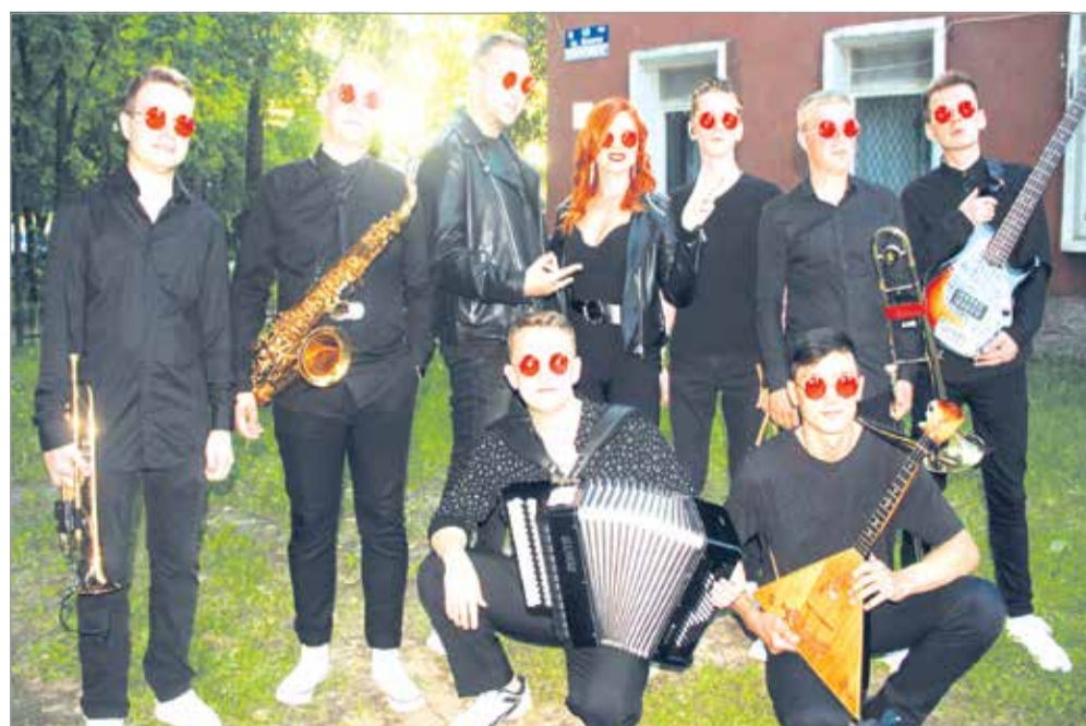
Шоу-группа из Санкт-Петербурга «Славянский хит»