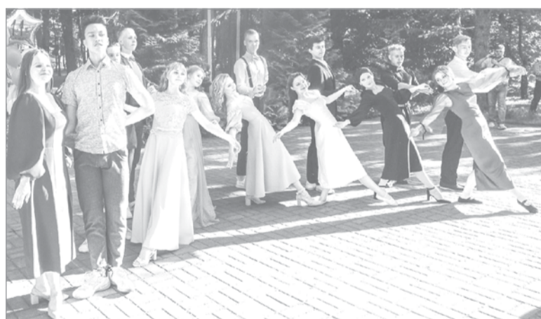
Под звуки нестарящего вальса...