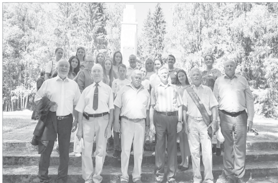
У памятника «Приказ»