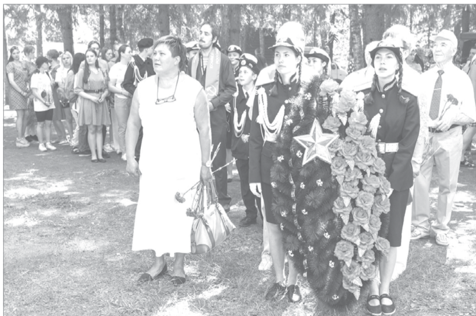
Венки и цветы – защитникам Свирского рубежа