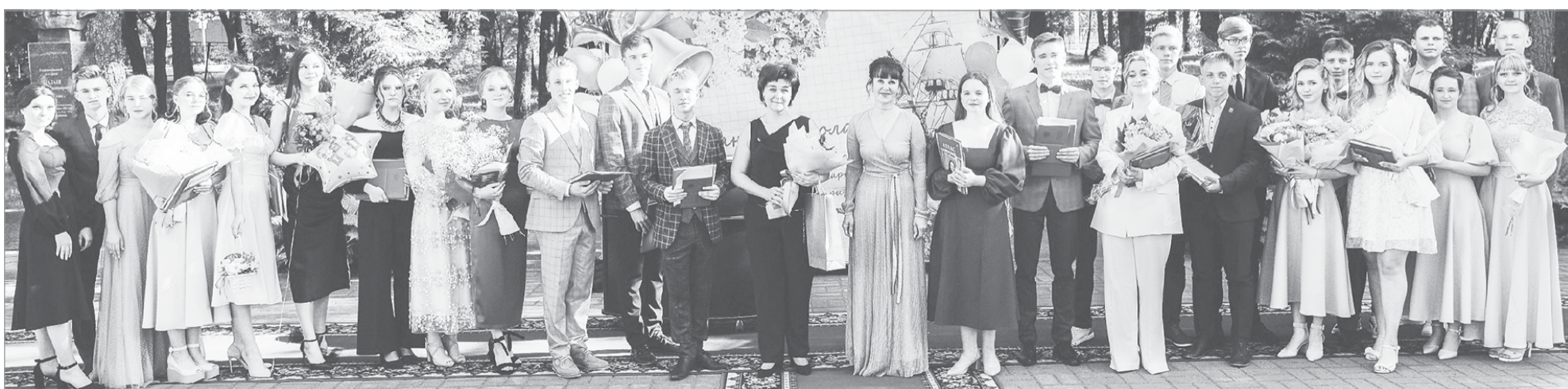
Все выпускники школы № 2 отмечены в различных номинациях