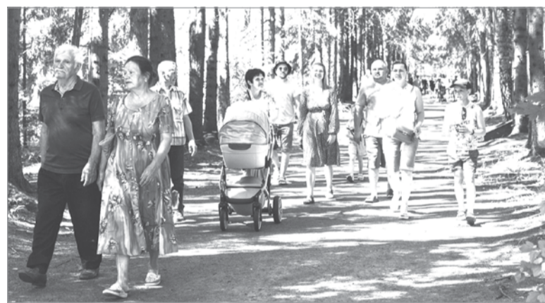
Лодейнопольцы гуляли по аллеям парка