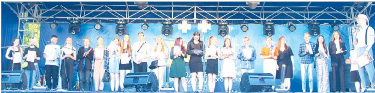
На главной сцене праздника наградили молодёжных активистов