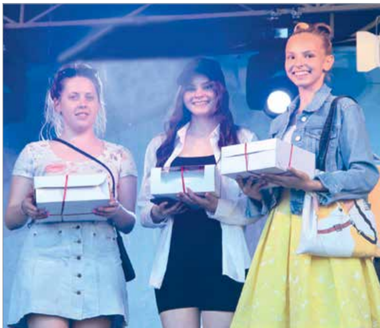
Вкусные торты – победителям конкурса репостов