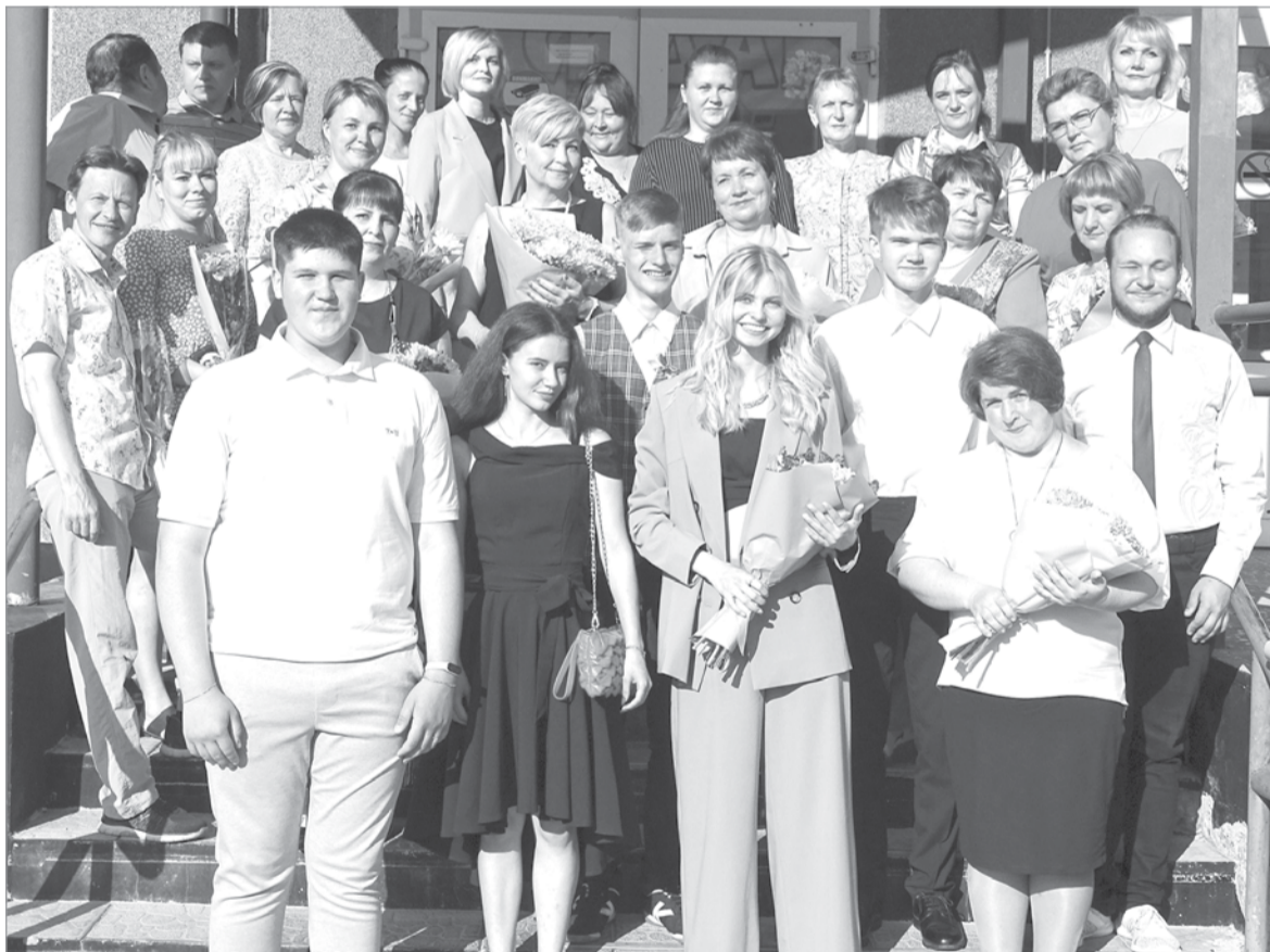
Юбилейный, 20-й выпуск в Рассветовской школе