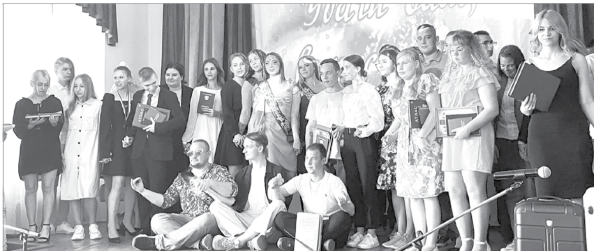
Один из самых творческих и креативных выпусков

29 июня в техникуме прошло торжественное собрание, посвященное вручению дипломов выпускникам 2022 года. Путевку в жизнь получили студенты групп по специальности «Технология деревообработки», по профессиям «Мастер столярно-плотничных, паркетных и стекольных работ», «Слесарь по ремонту автомобилей».