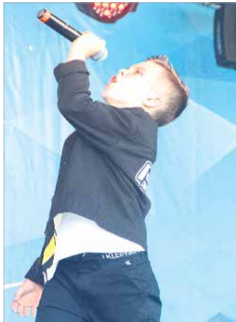
Творческие подарки от участников популярного музыкального проекта «Голос»